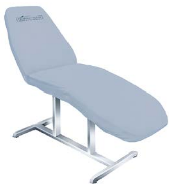
Pokrowiec na fotel