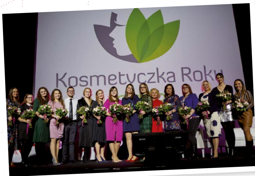
Finaliści konkursu Kosmetyczka Roku 2018

Zdobądź prestiżowy tytuł i wygraj nagrody!